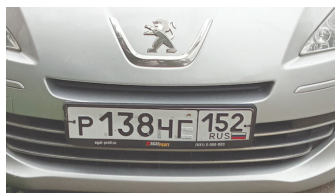
Если стереть зашпаклёванную белую краску, то номер читается так: P 138 HE 152

P.S. В июльском номере мы подняли проблему хамского отношения отдельных водителей к пешеходам (см. материал «Это они – мусор...») А вот на этом фото запечатлён автомобиль «Пежо», водитель которого может совершить ДТП и скрыться... безнаказанным. Смотрите, как он подкрасил свои номера, чтобы обмануть камеры слежения. Таких, конечно, надо без всяких сомнений лишать прав – они сознательно готовятся совершить преступление.