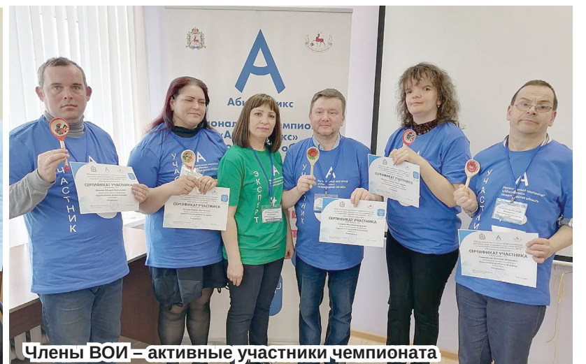
Члены ВОИ – активные участники чемпионата