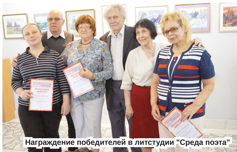
Награждение победителей в литстудии "Среда поэта"