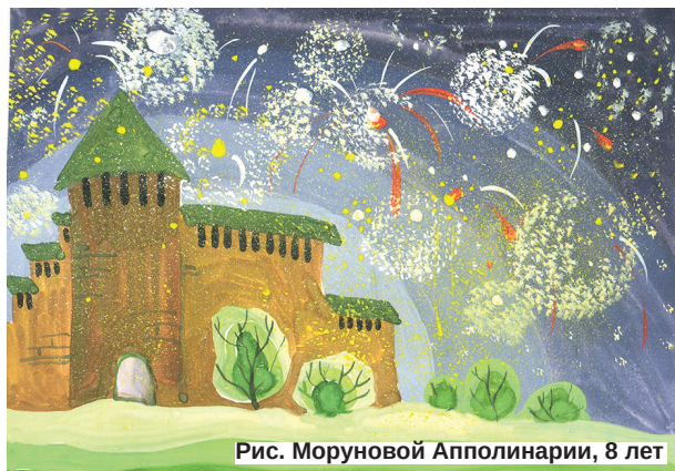
Рис. Моруновой Апполинарии, 8 лет