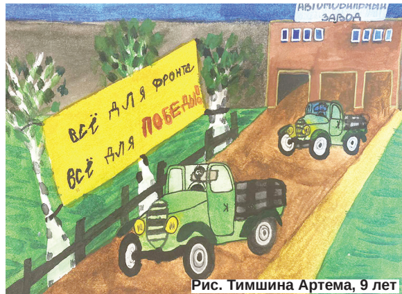
Рис. Тимшина Артема, 9 лет