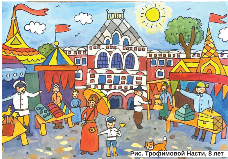
Рис. Трофимовой Насти, 8 лет