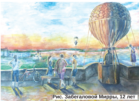
Рис. Забегаловой Мирры, 12 лет