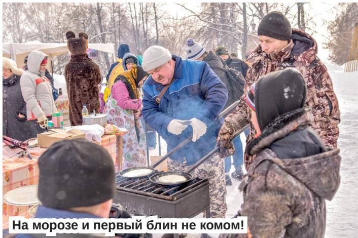
На морозе и первый блин не комом!