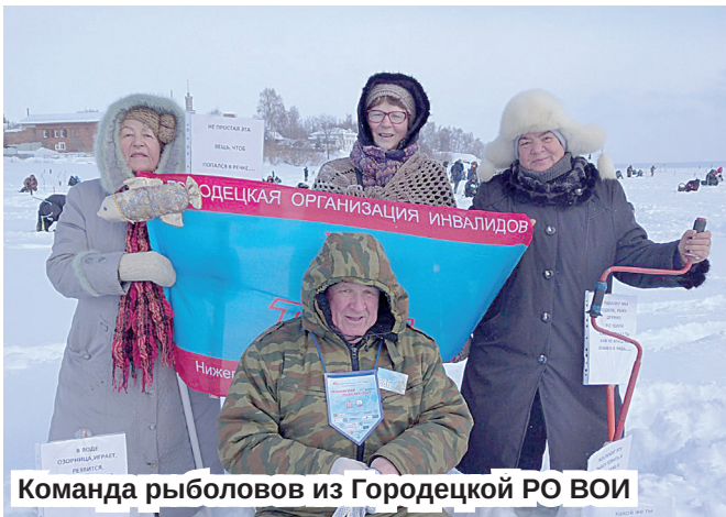
Команда рыбаков из Городецкой РО ВОИ