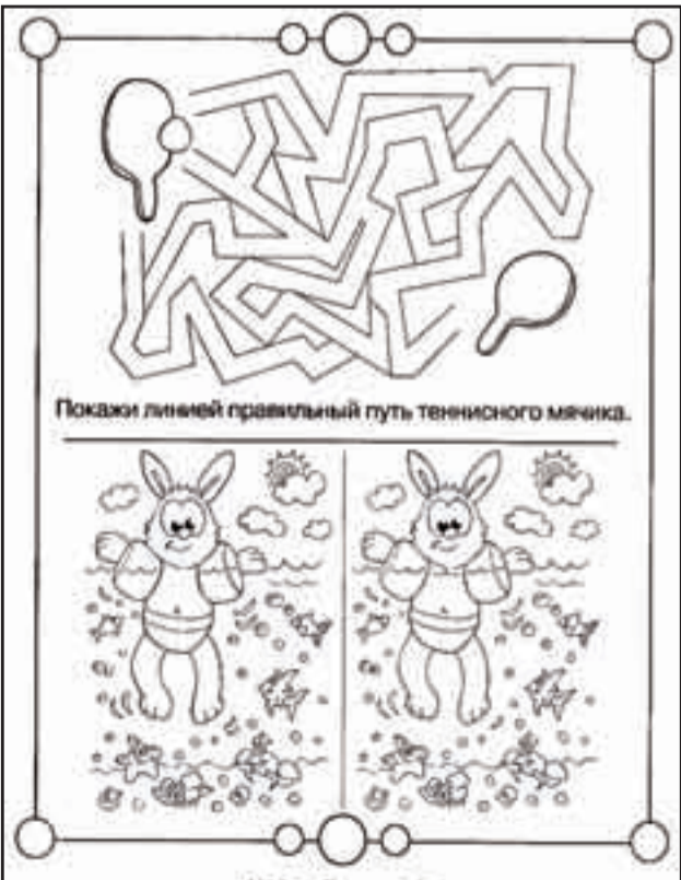
Найди семь отличий