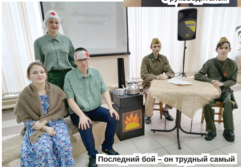
Последний бой – он трудный самый