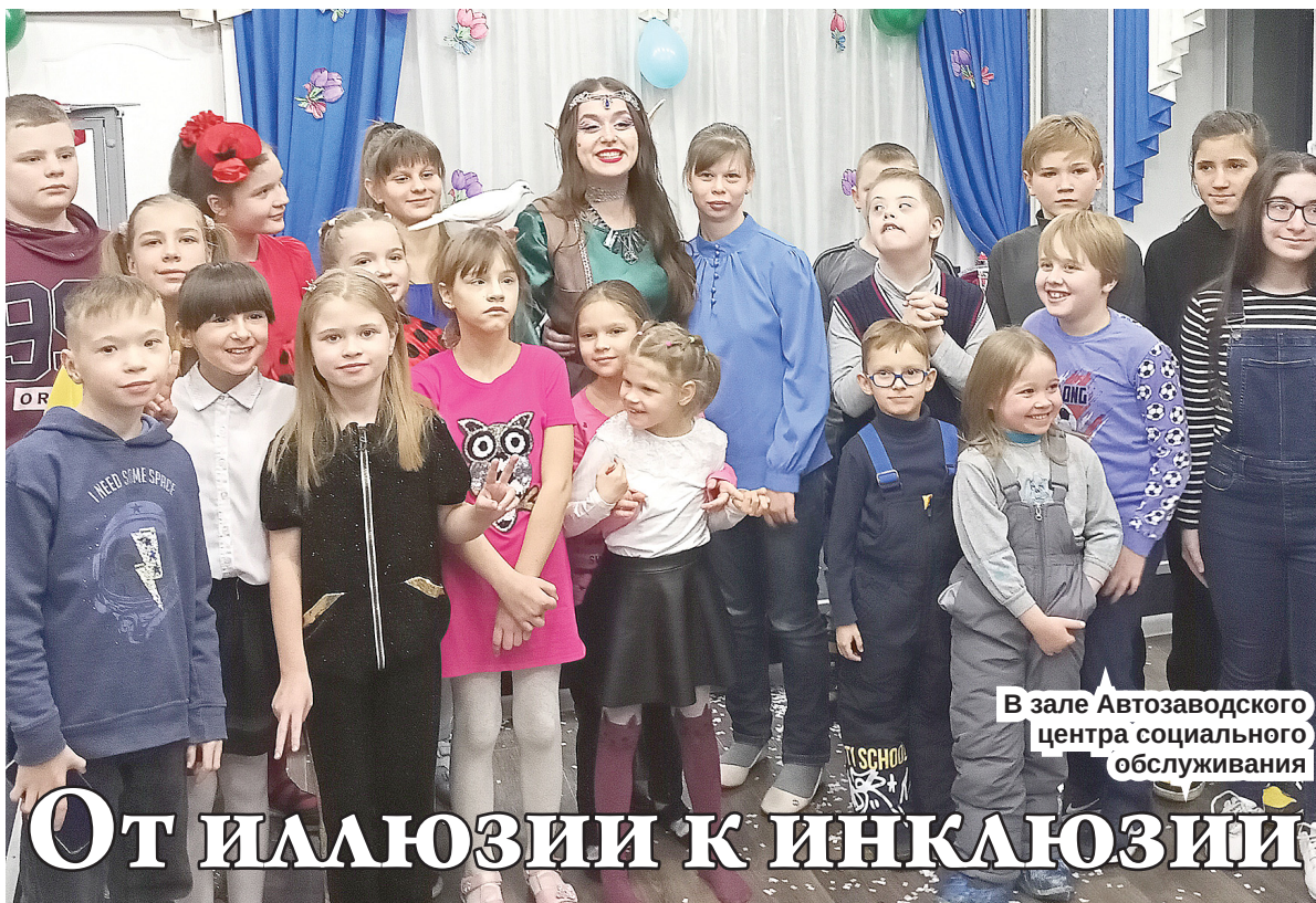
В зале Автозаводского центра социального обслуживания