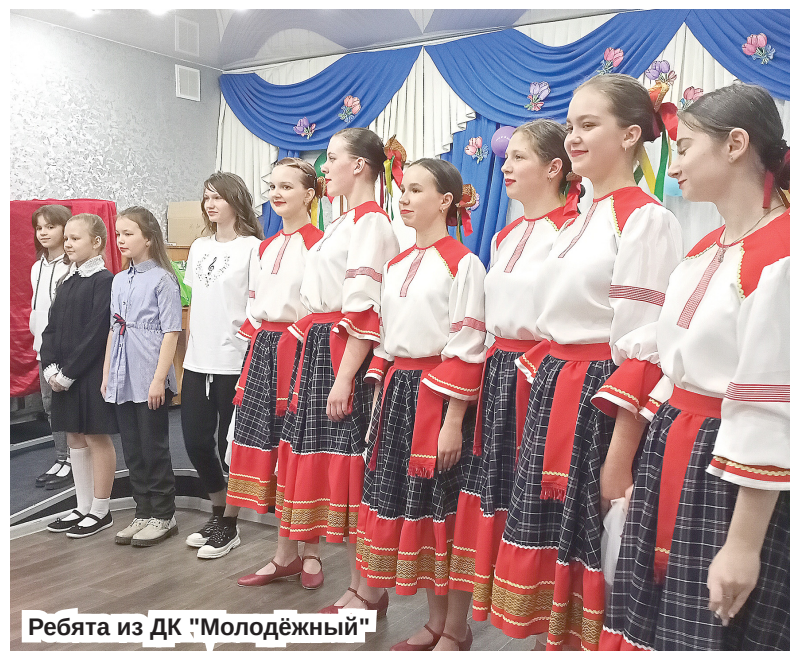
Ребята из ДК "Молодёжный"