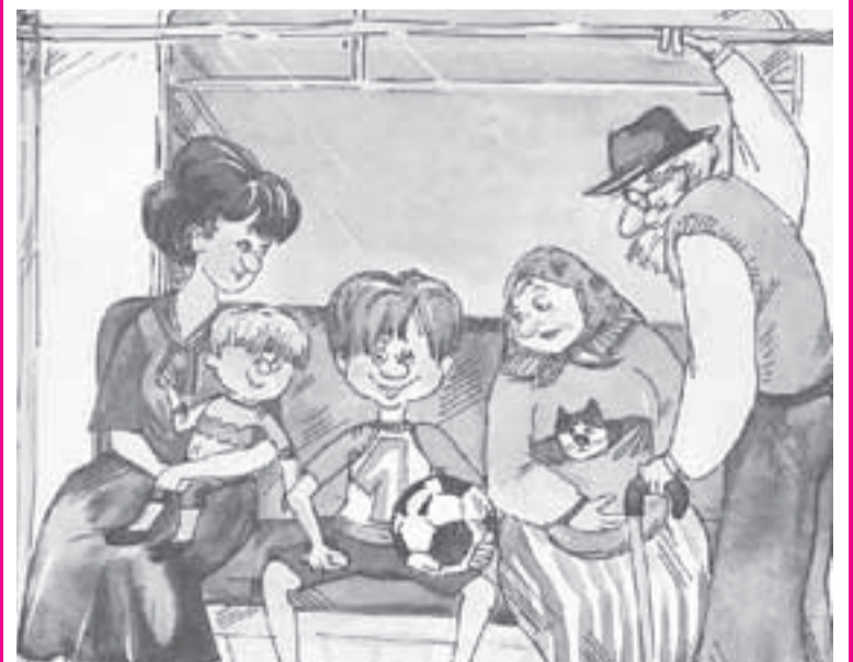
Что здесь не так?

Юнкор подписывает каждое свое послание в редакцию своим именем и фамилией, указывает адрес и телефонный номер (например, телефон родителей), по которому редакция при необходимости свяжется с автором.