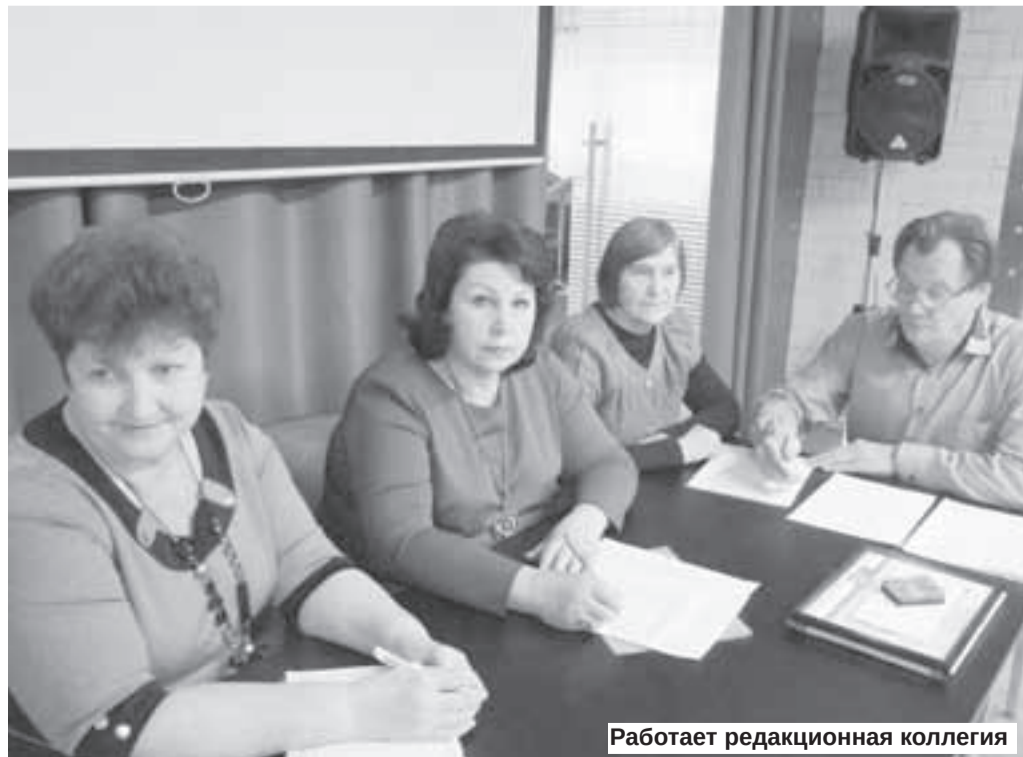
Работает редакционная коллегия