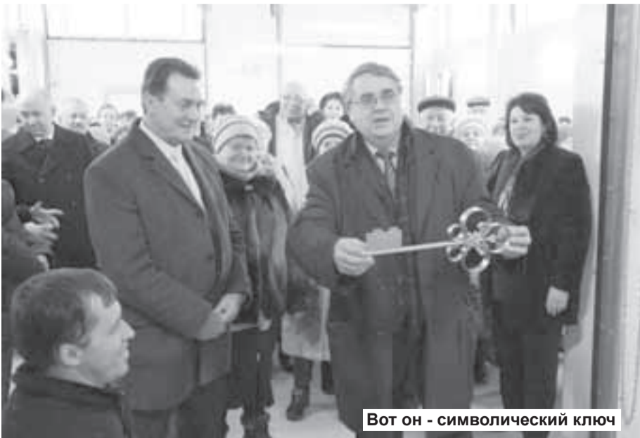
Вот он - символический ключ