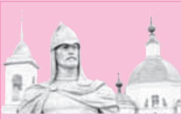
Александр Невский – знамя наших побед!