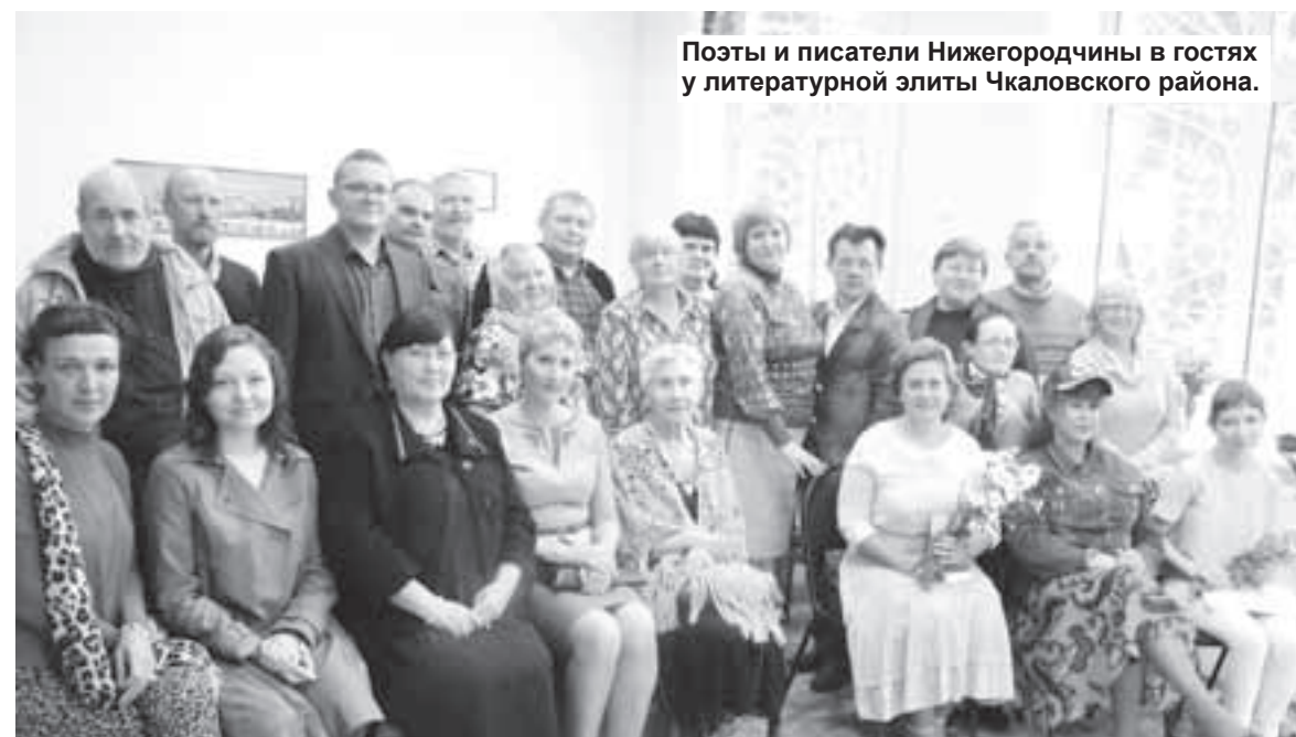
Поэты и писатели Нижегородчины в гостях у литературной элиты Чкаловского района.

В библиотеке села Катунки был организован семинар по поэтическому мастерству. Вел семи-