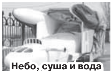
Небо, суша и вода

«Помолодевший» паровоз стал одним из важных символов праздничных мероприятий в Сормовском районе, приуроченных к 70-летию Победы.