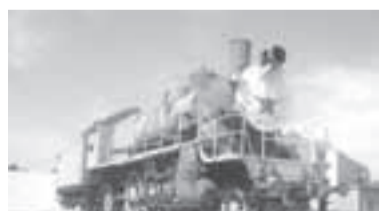
Наш паровоз-вперед лети!

«Наследники Победы» - это совместный региональный патриотический проект Городецкого отделения Всероссийской общественной организации ветеранов «Боевое братство» и Городецкой Епархии Русской православной церкви при поддержке администраций муниципальных образований области, региональных министерств социальной политики, образования, спорта.