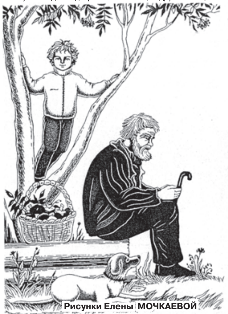
Рисунки Елены МОЧКАЕВОЙ

В бой за тебя и на плаху – Что же тут ждать, рассуждать? – В пламя, не думая, с маху – Стоит лишь голос подать.