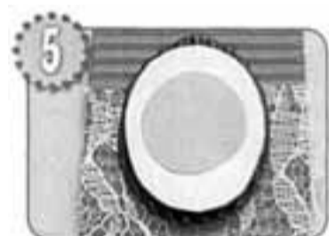
На квадрат картона наклей кусочек кружева, а сверху - две овальные детали с «желтком» посередине.