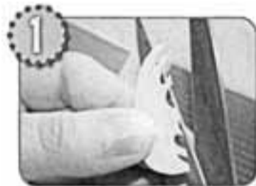
Сложи вдвое кусочек бумаги, вырежи половинку овала и по линии сгиба сделай фигурные надрезы.

бумага, ножницы, клей, гофрированный картон, нитки, кружева.