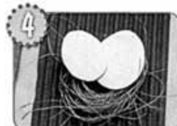
Из плотной белой бумаги вырежи два яйца и наклей их поверх «гнездышка».